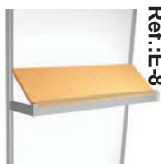
Balda inclinada haya