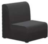
Módulo Sillón: Tela Negro Tela Gris Tela Azul Tela Teja Indicar color al rellenar la ficha