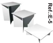
Podium crucetas 100 cm alto 75 ancho 75 largo 75 cm alto 75 ancho 75 largo 50 cm alto 75 ancho 75 largo