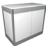
Armario aluminio 2 puertas 80 cm alto 53 ancho 103 largo