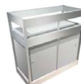
Mostrador Vitrina 100 cm alto 53 ancho 103 largo