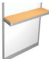
Balda horizontal haya