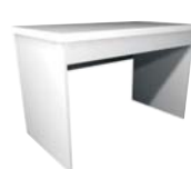
Mesa Arena 1.8x0.8 m Mesa Arena 1.2x0.8 m