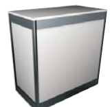
Mostrador Aluminio 100 cm alto 53 ancho 103 largo